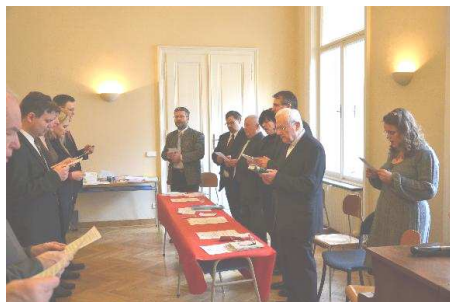
Společný zpěv úvodní písně Přijď, Tvůrce, Duchu Svatý