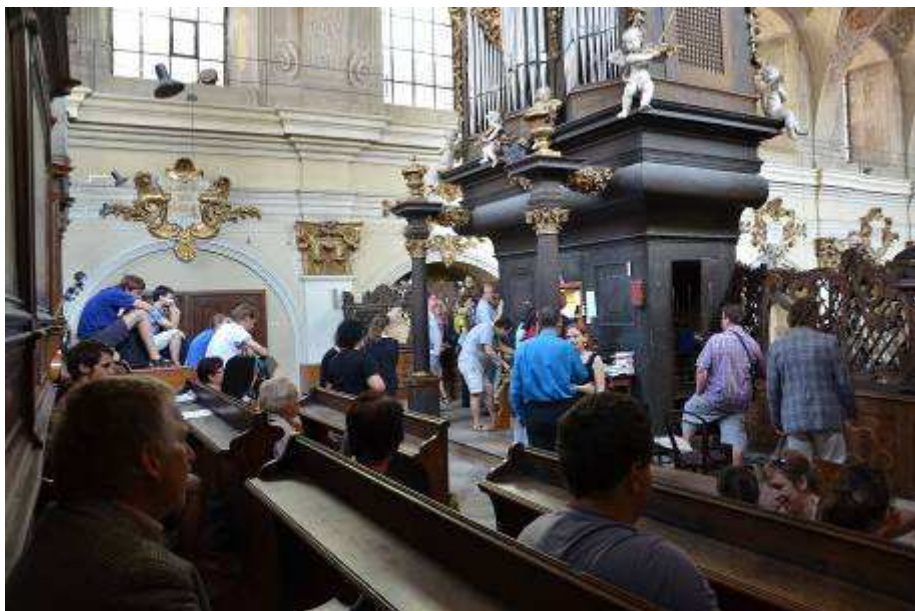
U varhan v kostele sv. Janů u minoritů