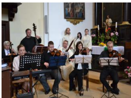
Orchestřík doprovázející sbor