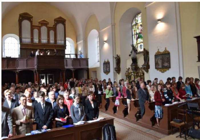
Kostel zaplnili absolventi kurzu a jejich blízcí

Krásné setkání pak ještě více než dvě hodiny pokračovalo v prostorách Katolického gymnázia pohoštěním pro všechny přítomné.