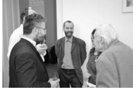
Střípky z agapé