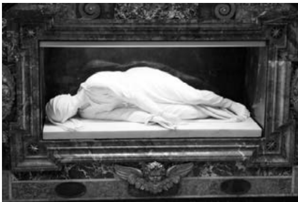
Hrob sv. Cecílie v Římě