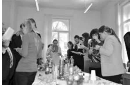
Více fotografií naleznete na našem webu ve fotogalerii.