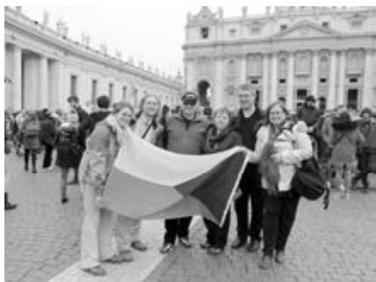
Na svatopetrském náměstí po Anděl Páně s Františkem