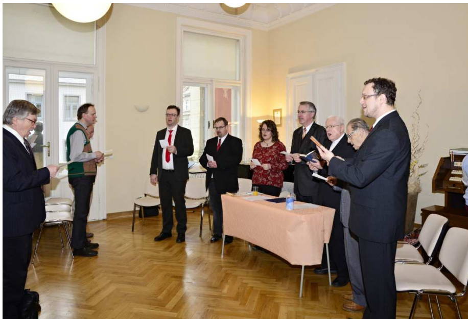
Jednání bylo zahájeno vzýváním Ducha Svatého (píseň č. 423)