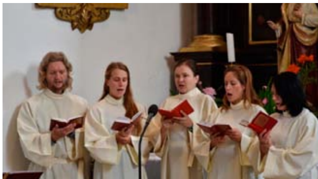
Schóla od sv. Mikuláše ve Znojmě při slavnostních nešporách na zakončení varhanického kurzu v Třebíči-Jejkově 2015